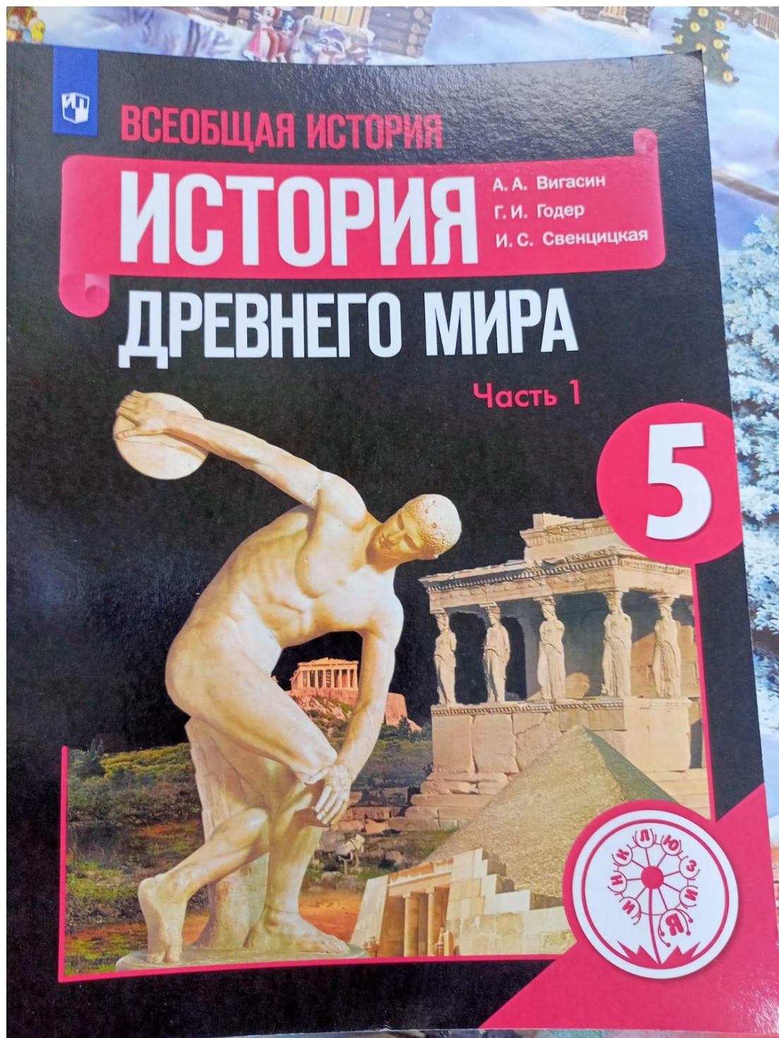
Фото №1. Учебник для слабовидящих.

Приложение к акту выполненных работ по адаптации объекта и повышению уровня доступности образования для людей с инвалидностью и маломобильным группам населения (МГН) в период с 2018 по 2022 годы к паспортам доступности ОСИ № 92 от 17.07.2018 года