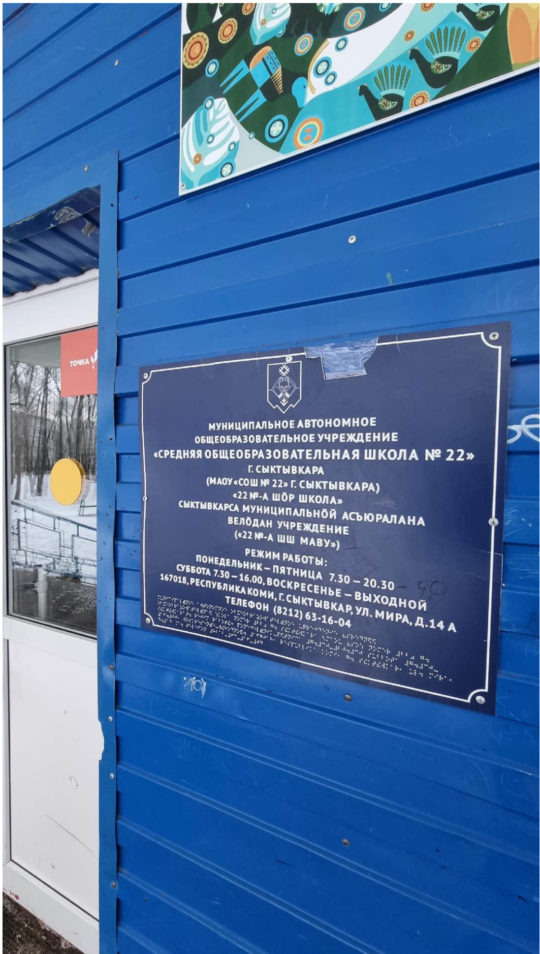
Фото №3. Табличка на входе в здание школы выполненная шрифтом Брайля.